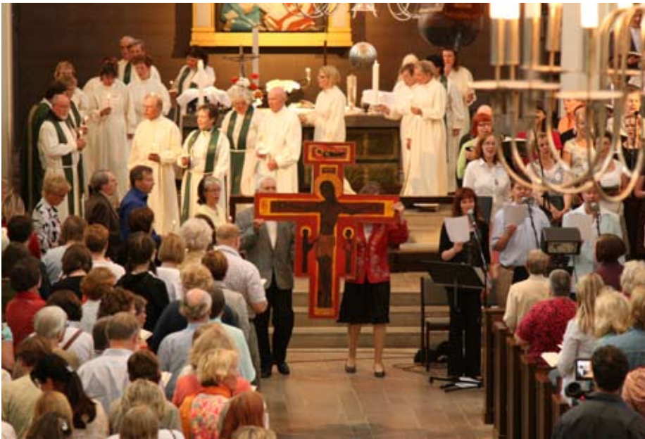
Tuomasmessu tuo juhlan Agricolaan joka sunnuntai kello 18.